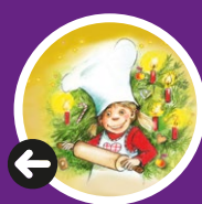
Illustration: Julia Giesbach

EMPFEHLUNG: DIE WEIHNACHTSBÄCKEREI FR 20.12.19 14:30 UHR + 17:45 UHR